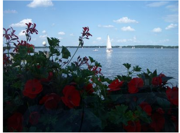
Kurpark nur fünf Fußminuten entfernt