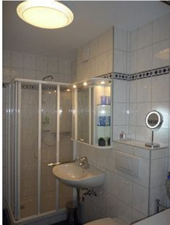
Oberlicht dimmbar Warm oder Kaltlicht