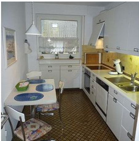
Alle Elektrogeräte erneuert